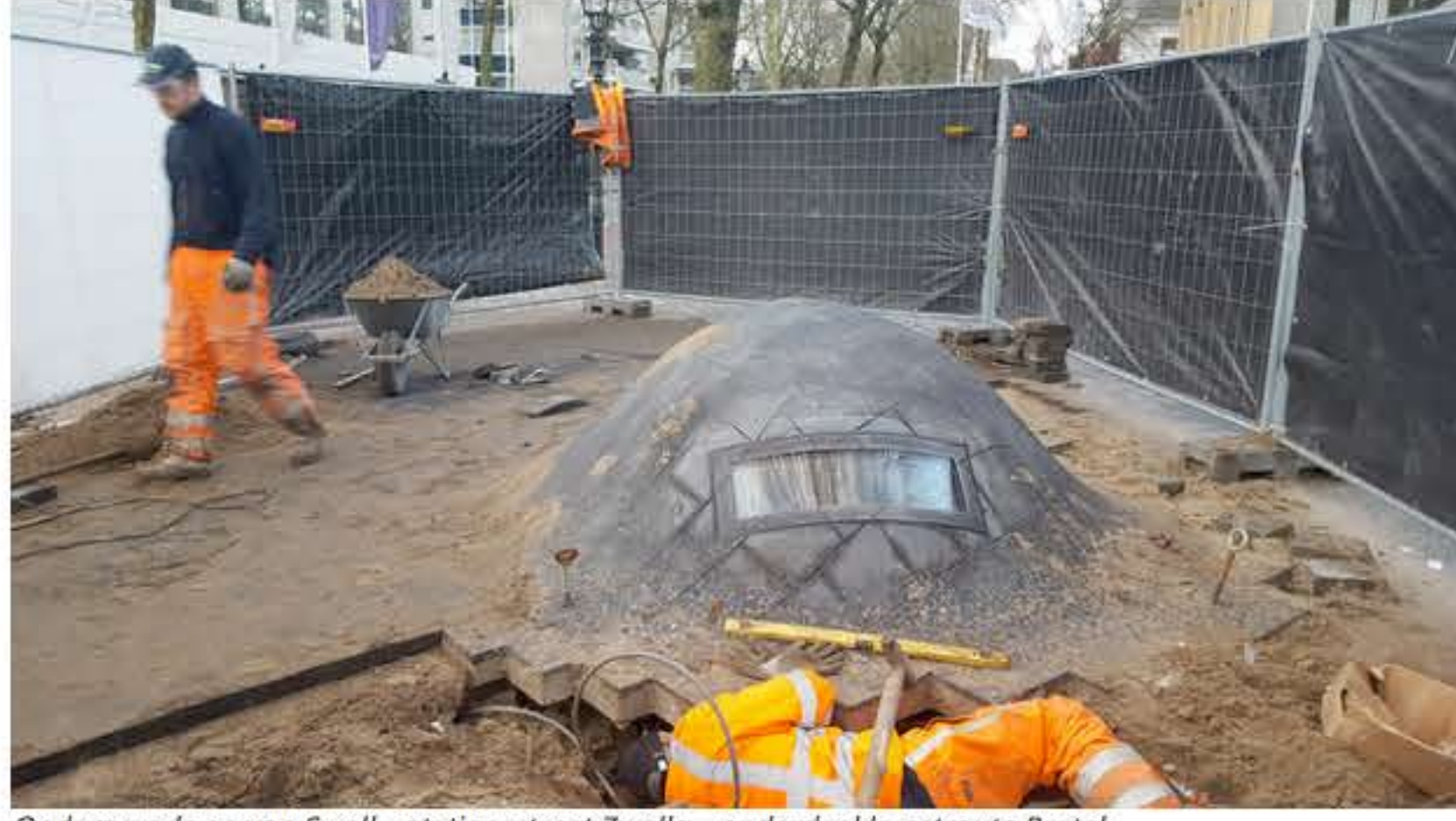
Ondergronds perron Swoll – stationsstraat Zwolle – onderdeel kunstroute Portal

De kunstroute die bestaat uit een blauwe bronzen lijn, een video-wall in de stationstunnel, een bronzen kaart van de stad Zwolle en een audioscoop zal op 23 januari worden onthuld.