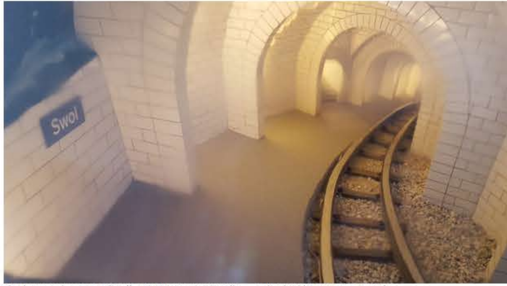
Ondergronds perron Swoll – stationsstraat Zwolle – onderdeel kunstroute Portal