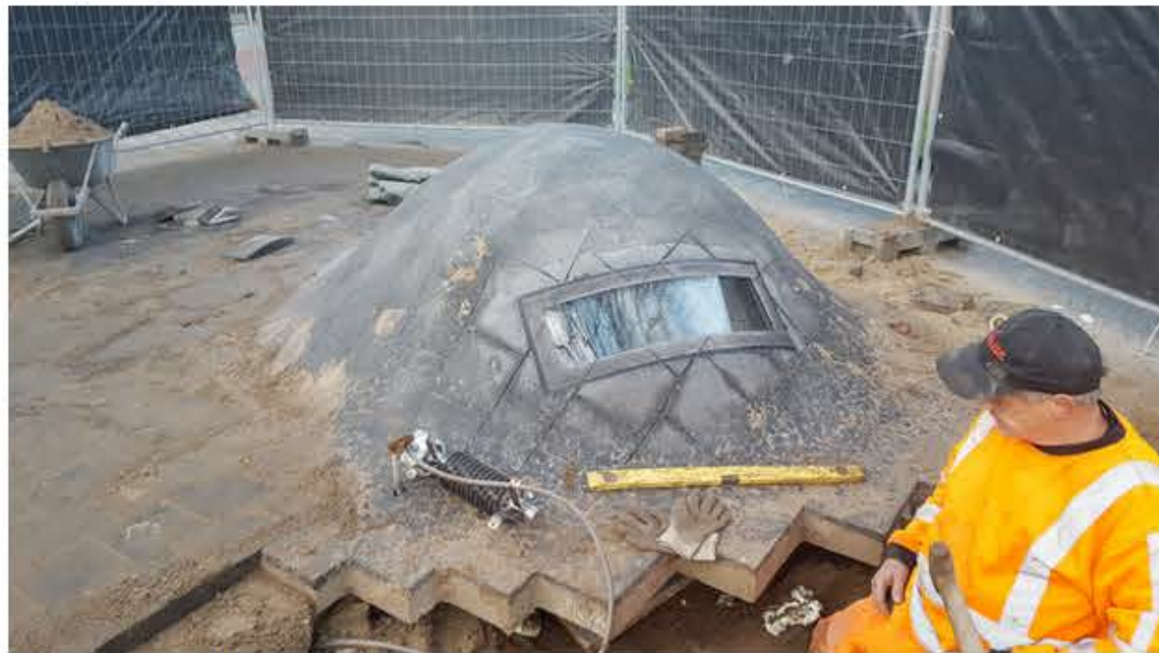
Ondergronds perron Swoll – stationsstraat Zwolle – onderdeel kunstroute Portal