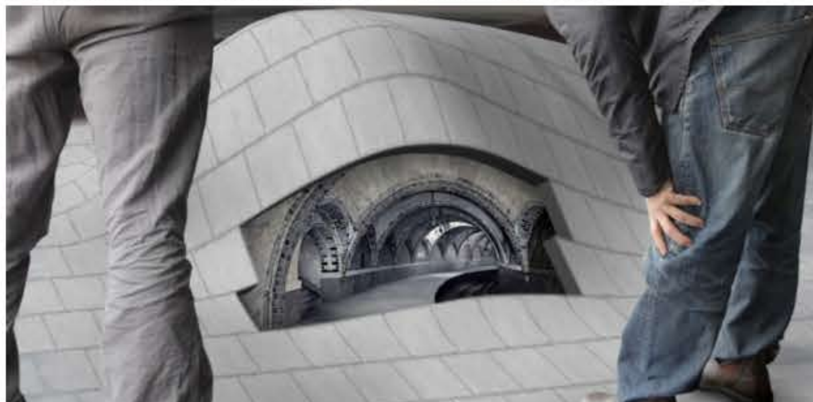
Ondergronds perron Swoll – stationsstraat Zwolle – onderdeel kunstroute Portal