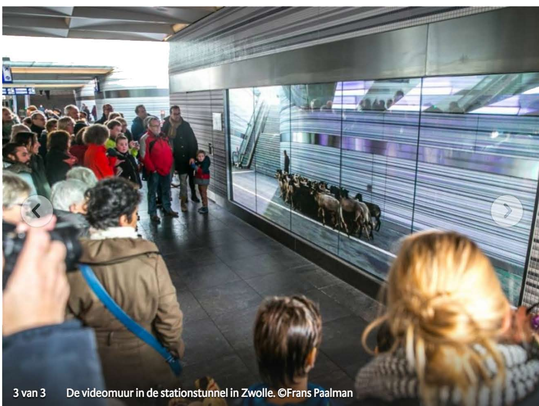
3 van 3 De videomuur in de stationstunnel in Zwolle.